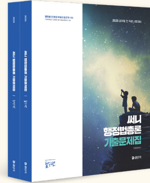
[25년 교재입니다. 26년 개정판 출간예정]

★기출문제와 핵심ZIP약을 병행한다면 좀 더 입체적인 학습을 할 수 있음★