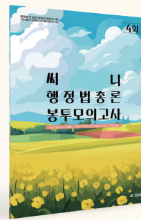
[25년 교재입니다. 행정법 유일한 봉투형 모의고사]