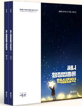
[25년 교재입니다. 26년 개정판 출간예정]

(단, 기본기가 부족하다고 판단된다면, 재시생도 올인원을 다시 수강할 것을 권장 드림)