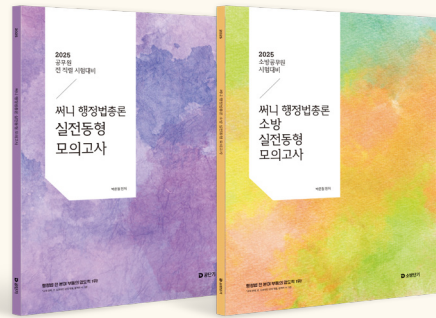
[25년 교재입니다. 26년 개정판 출간예정]

(자신만의 행정법 시험 전략을 만들어) 시험을 주도적으로 보기 : 소거법, 익숙한 선지 먼저 보기, 어려운 문제가 나왔을 때, 어떻게 대처할 것인지 생각 등