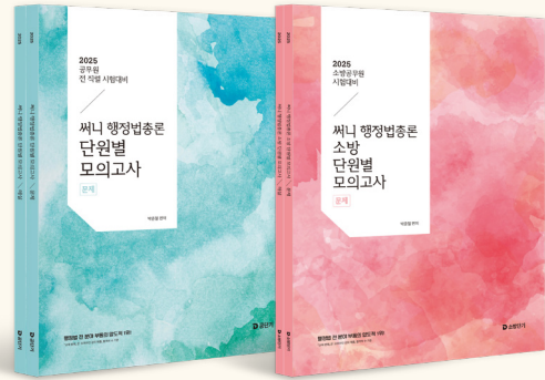
[25년 교재입니다. 26년 개정판 출간예정]