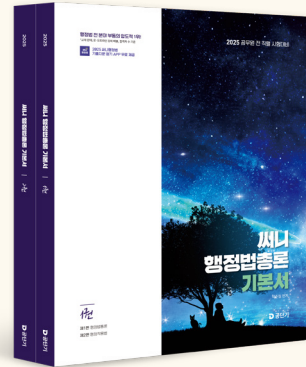
[25년 교재입니다. 26년 개정판 출간예정]